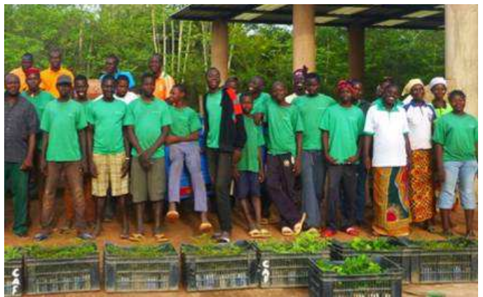
Ecole du bocage : formation pépinière (écoliers en vert)